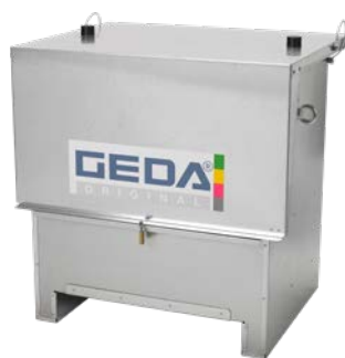
Liftbox Art.-Nr. 46309

Weiteres Zubehör finden Sie unter: www.geda.de