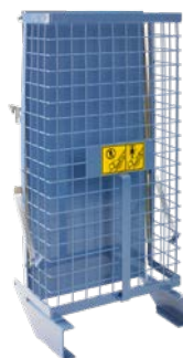
Ziegelpritsche Art.-Nr. 02860