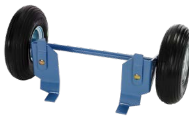
Fahrgestell Art.-Nr. 02886