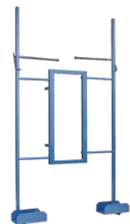
Plattenpritsche Art.-Nr. 02831