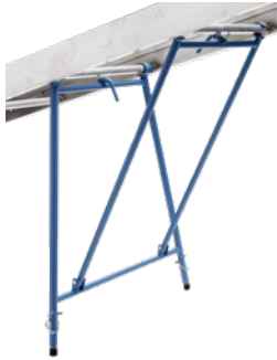
Abstützung für Plattenpritsche Art.-Nr. 02812