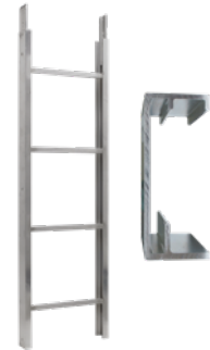
Leiterteil 2 m 250 kg Art.-Nr. 02888