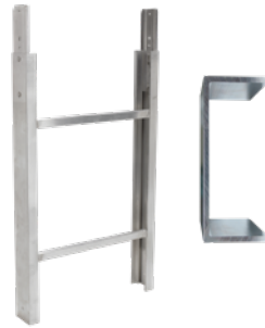
Leiterteil 1 m 200 kg Art.-Nr. 03379