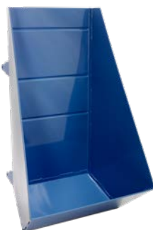
Kippmulde (für Kippschlitten) Art.-Nr. 02856