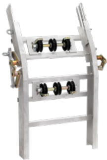
Knickstück Art.-Nr. 02828