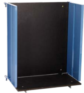
Universalpritsche Art.-Nr. 02893