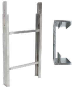
Leiterteil 1 m 250 kg Art.-Nr. 02889