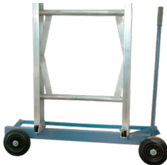
Fahrwerk Art.-Nr. 02822