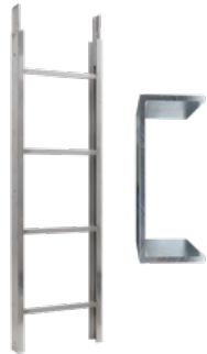
Leiterteil 2 m 200 kg Art.-Nr. 03378