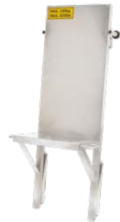
Dachziegelverteiler Art.-Nr. 02884