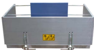
Große Transportbühne Art.-Nr. 02253