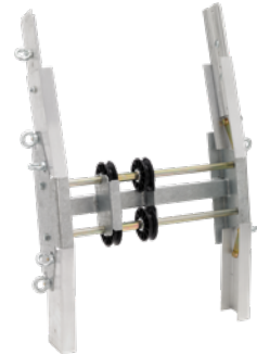
Knickstück Art.-Nr. 02877