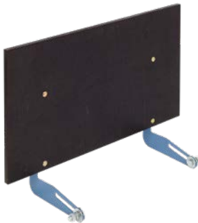
Frontschutz für Universalpritsche Art.-Nr. 02862