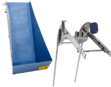
Kippmulde mit Kippvorrichtung Art.-Nr. 02818