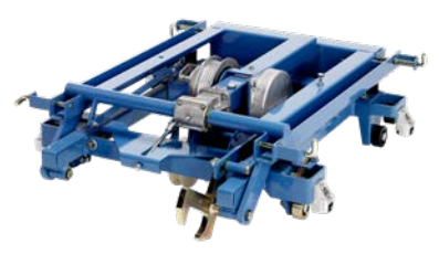
Kippschlitten Art.-Nr. 02855