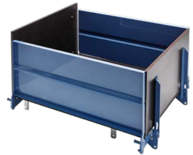
Vario-Bühne Art.-Nr. 02895